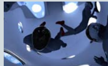
Illustration: Virgin Galactic

Inom några år är det dags för rymdturismen att etablera sig i Kiruna, men redan nu är det möjligt att få fördjupad information kring detta ämne. Föreläsningen inleds med information om vad rymdturism är. Därefter får gruppen ta del av hur arbetet med att etablera Spaceport Sweden har gått till. En spännande resa som startade 2005.